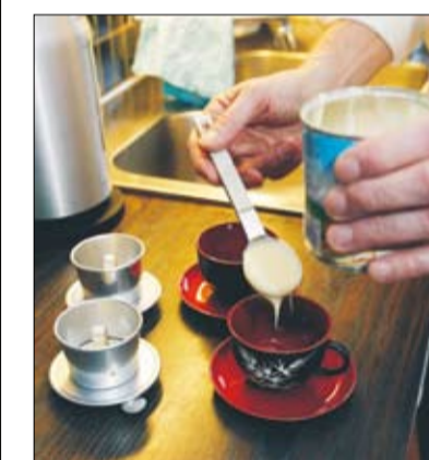
Vietnamesiskt kaffe bryggs direkt i koppen. Med en sked kondenserad mjölk blir det en söt efterrätt.