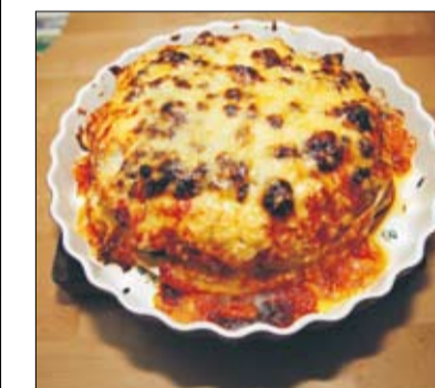
Naturligtvis innehåller tårten ost; philadelphia och lagrad prästost.