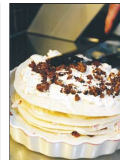
Sex lager tortillas är det i Sigbjörns tacotårta. Översta lagret täcks med prästost.