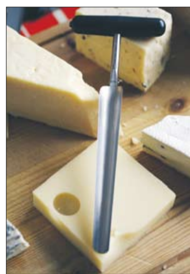
En ostburr måste en ostmästare ha. Med den plockas en bit ut från mitten, toppen bryts av och avsmakas. Sedan skjuter man in ostpelaren igen. Det görs regelbundet under hela mognadsprocessen.

nare om det blir någon bit över, tycker han.