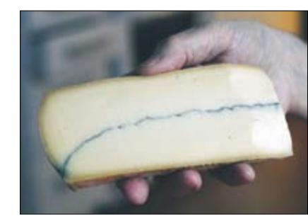
Morbier: en kittost – behandlas med bakteriekulturer på ytan för att påskynda mogningen. Det är en halvårdost från Frankrike, som har ett lager av träaska i mitten. Förr använde herdarna sot från ystskaret för att skilja morgon- och kvällsmjölken åt, och detta blev den så kallade Morbierosten